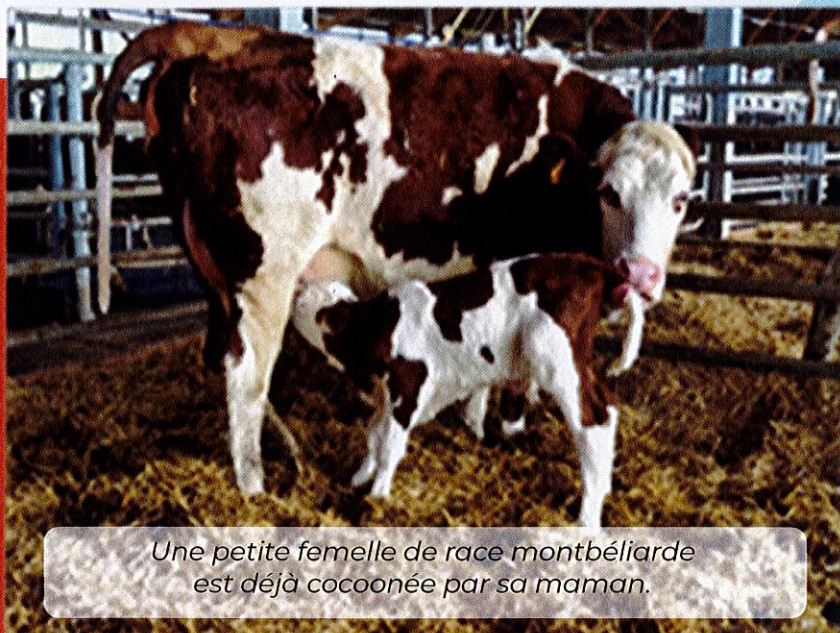
Une petite femelle de race montbéliarde est déjà cocoonée par sa maman.

Marcinelle, c'est 62 hectares de prairies permanentes, 28 vaches laitières et leur suite, un élevage 100% herbager, zéro intrant et le respect du bien-être animal.