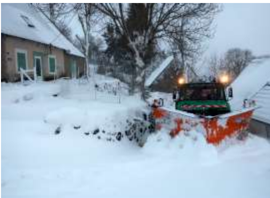
Chasse-neige à la Renordie, heureusement qu'il n'y pas de voiture mal garée !

Il est impératif dans ce genre de situation de garer les véhicules dans les espaces privés ou garages pour dégager les trottoirs devant les habitations. Cette règle de bon voisinage est aussi une règle d'entre-aide et de solidarité.